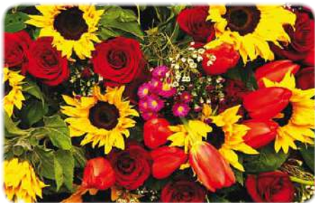
Наши поздравления (стр. 5)

Информацию предоставил В. П. Голова, проректор по ресурсному обеспечению