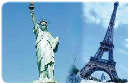
Преподаватели ИГЭУ за рубежом (стр. 6–7)