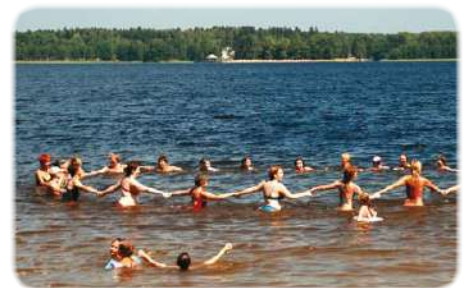
Лето вдали от цивилизации (стр. 11)