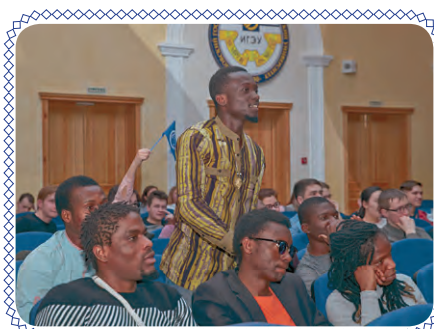
С надеждой на победу (стр. 5)