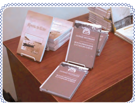
Читаем все! (стр. 4)