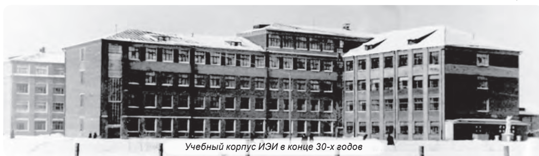
Учебный корпус ИЭИ в конце 30-х годов