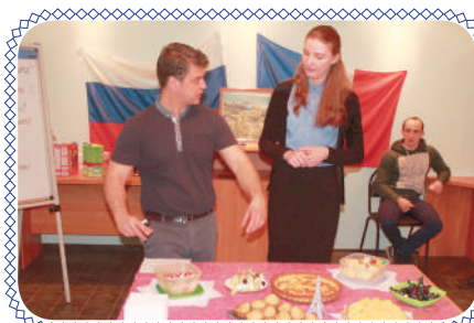
Мир, дружба, ИГЭУ! (стр. 6-7)