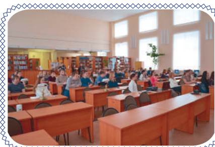
Все в читальный зал! (стр. 5)