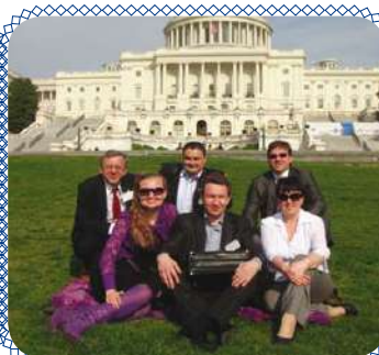
Образование: заимствуем лучшее?.. стр. 8 – 9