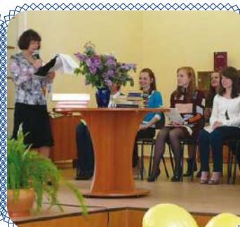
Читать не вредно, вредно не читать! стр. 10 – 11