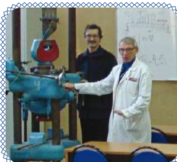
Юбилей ЭМФ стр. 4 – 5