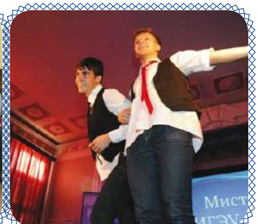
Первый парень в ИГЭУ стр. 14 – 15