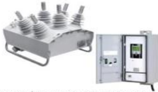
Введен в работу высокотехнологичный Тамбовский РЭС