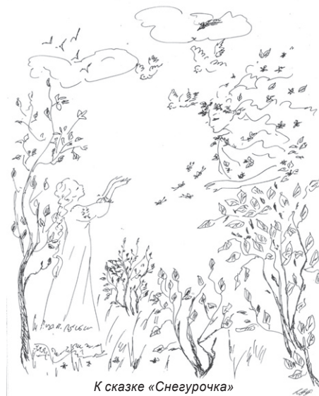
К сказке «Снегурочка»