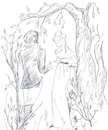
К произведению «Евгений Онегин»