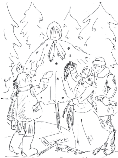
К рассказу «Прощеный день»

Как признается Лидия Валерьевна, рисует она по велению души: «Я равнодушна к искусству с молодых ногтей, особенно к полиграфии, очень люблю хорошо изданные