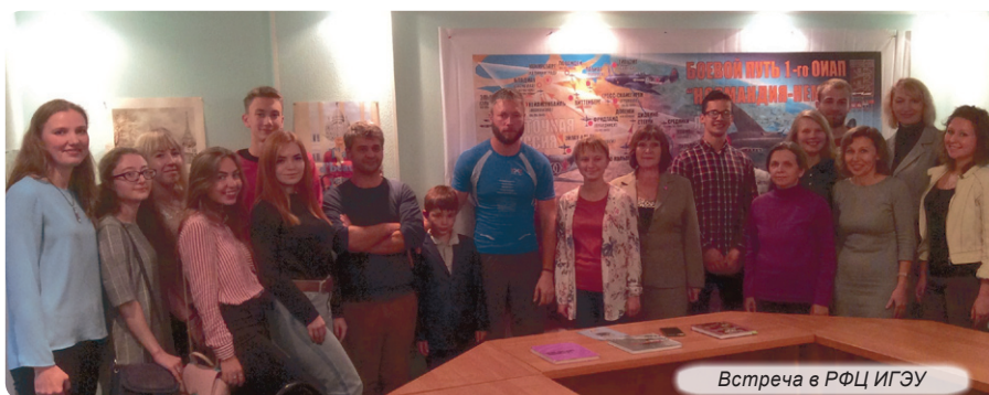
Встреча в РФЦ ИГЭУ