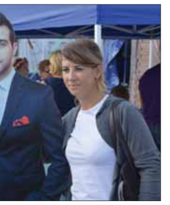
Поток людей не ослабевал весь день. Все хотели прогуляться по ярмарке, посмотреть на исторические бои, пострелять из лука и арбалета, приготовить овощное блюдо, испробовать знаменитой настойки, сплести луковые косы, научиться водить трактор, поспорновать в скорости шинковки лука и его поедания. В последнем кон-

курсе поучаствовали и мы, получив в качестве приза вкуснейшие пирожки.