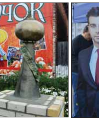
которой поется в хите, действительно стала золотой. Найти ее оказалось непросто, ведь в город ухлынула река туристов. Они заполнили и главную площадь, и парк, выходящий к деревянной крепости.