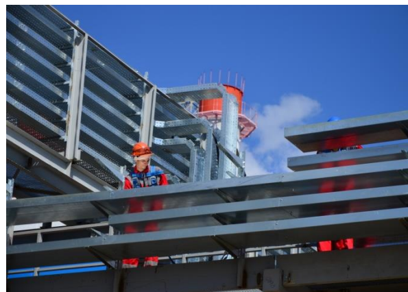
Строительство ПГУ-223 МВт Воронежской ТЭЦ-1