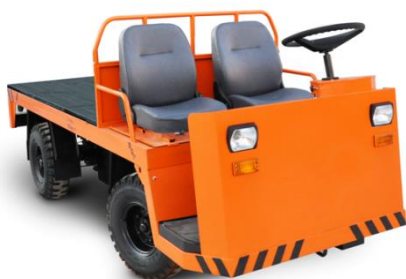
Электротележки серии ЕТ без кабины