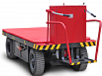
Электротележки серии ЭК