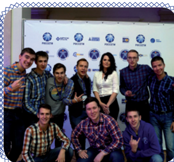
ССО «Ива»: победа возможна! (стр. 6)