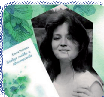
«Меня однажды вспомнят...» (стр. 10)