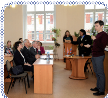
LSI: английский для целеустремленных (стр. 4 – 5)