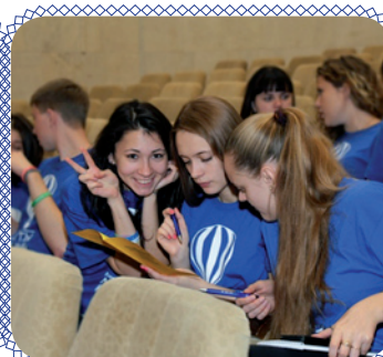
Школа позитива (стр. 9)