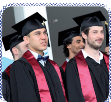
Новости из Безансона (стр. 7)