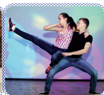
На сцене – энергетик! (стр. 10)