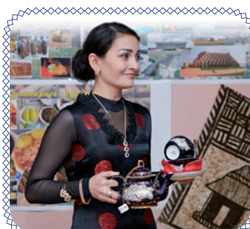
«Вкусный» конкурс (стр. 4)