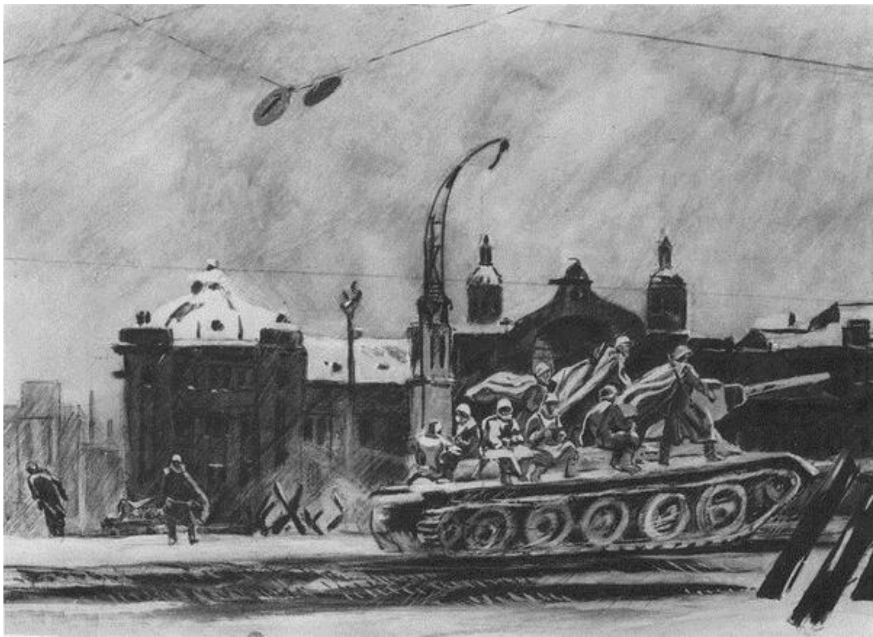
«Танки идут на фронт»