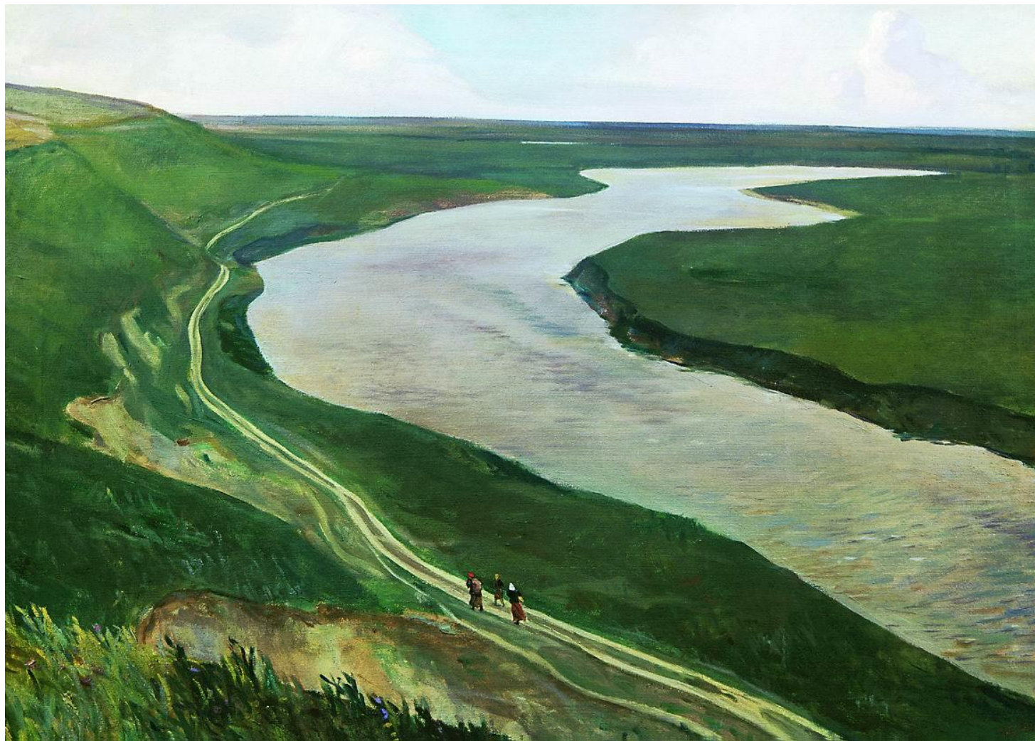
«Под Курском. Река Тускорь»

Есть у Дейнеки и чисто пейзажные работы. Одна из них – «Под Курском. Река Тускорь» (1945). В ней он также показывает себя мастером оригинального, неповторимого таланта. И хотя произведение это на первый взгляд несколько сурово, оно наполнено большой душевной теплотой.