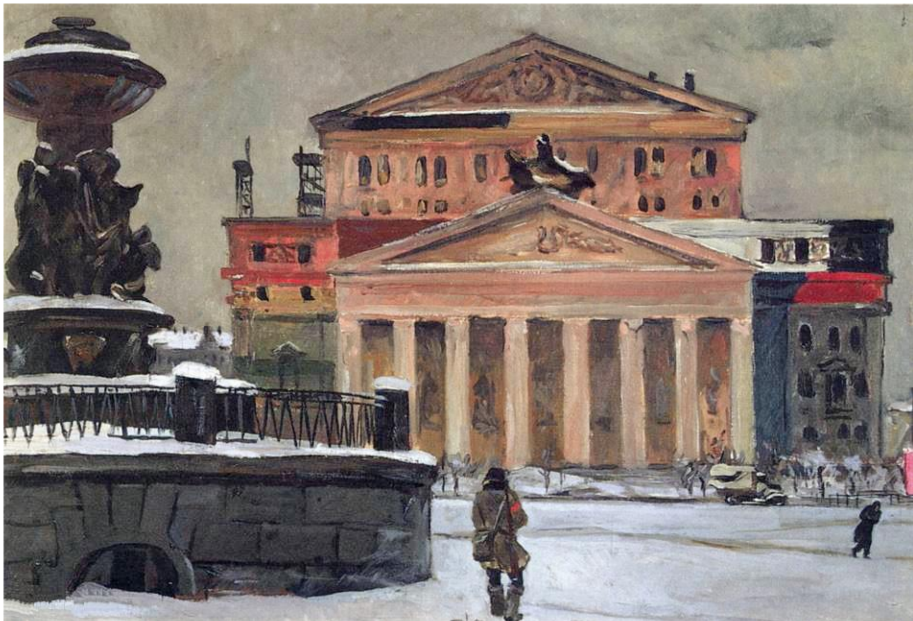
«Площадь Свердлова в декабре 1941 года»