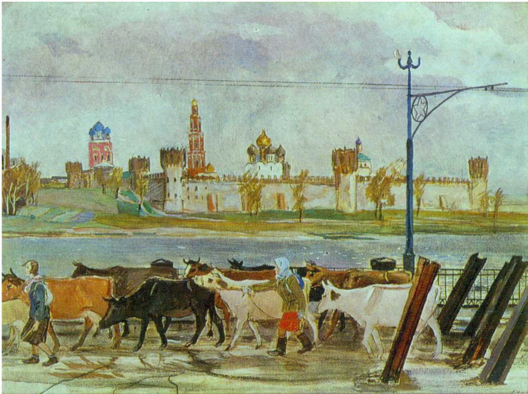
«Эвакуация колхозного скота»