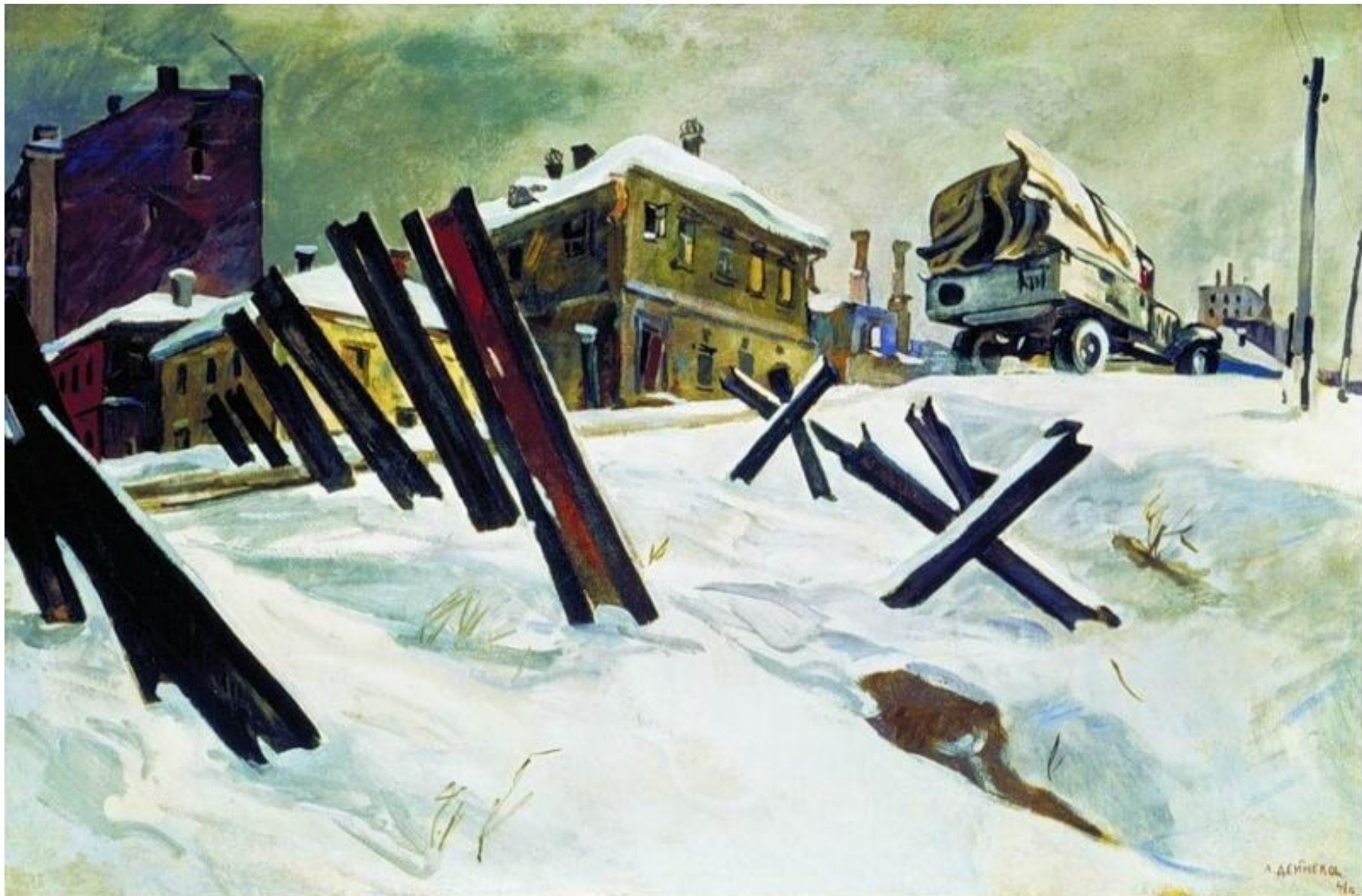
Картина «Окраина Москвы. Ноябрь 1941 года» (1941)

В период Великой Отечественной войны Дейнека создал другие произведения.