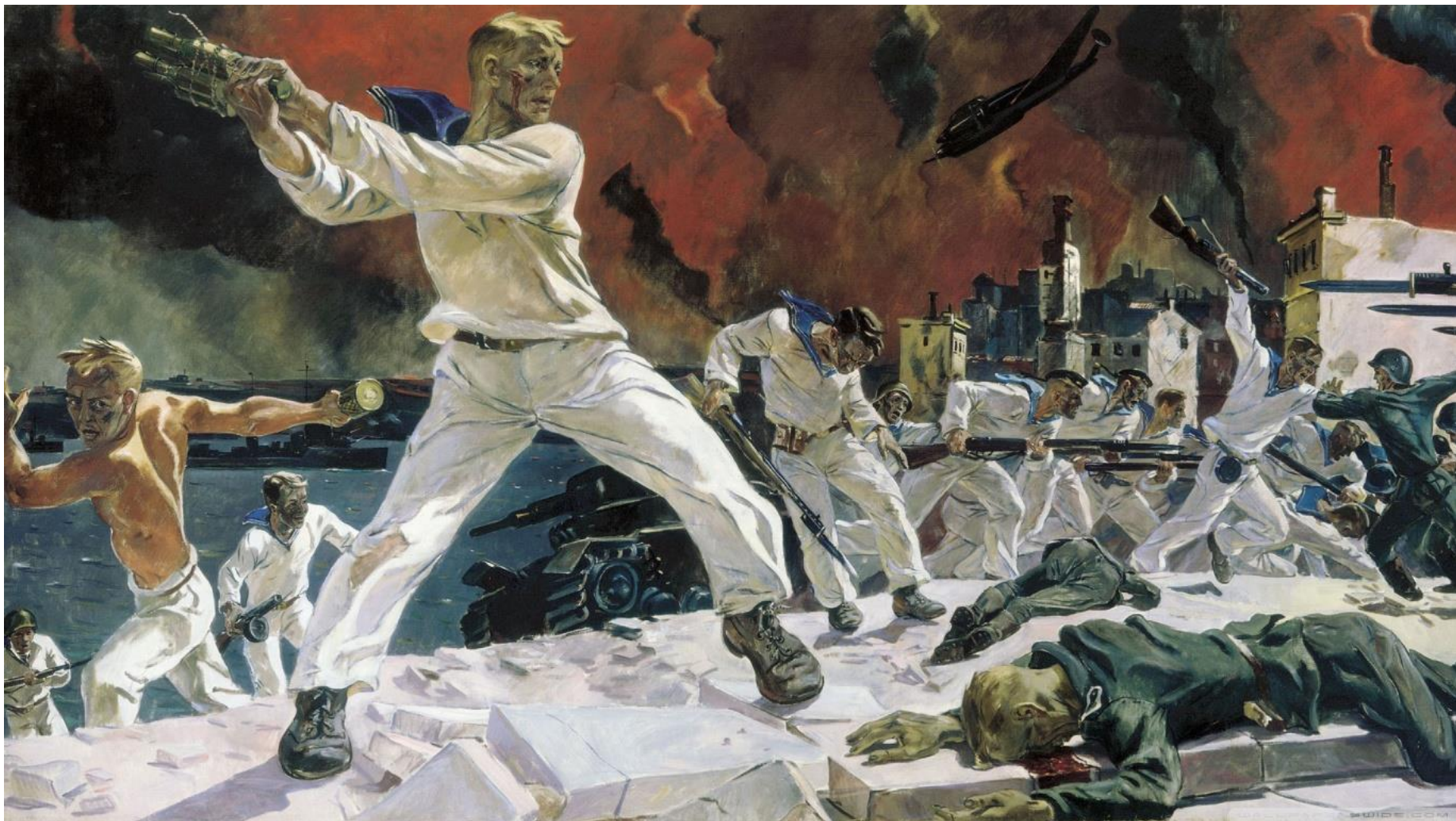
Картина «Оборона Севастополя» (1942)

Пронзительный трагизм и эмоциональная мощь живописи и графики А.А. Дейнеки военных лет уникальны для русского искусства XX века. Одна из самых сильных картин Дейнеки - «Оборона Севастополя» (1942) - скорбная и величественная героическая эпопея о подвиге защитников Севастополя.