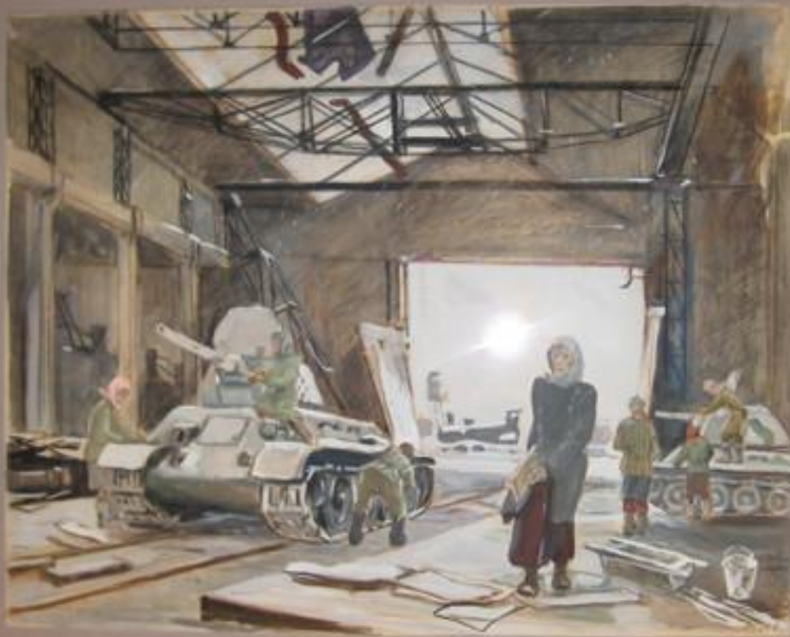
«Ремонт танков на прифронтовом заводе»