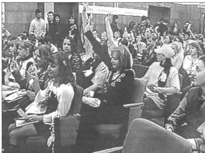
Во время социально-оздоровительной акции «Скажи жизни: "ДА!"» в Шуйском государственном педагогическом университете

Устный журнал, подготовленный библиотекарями совместно